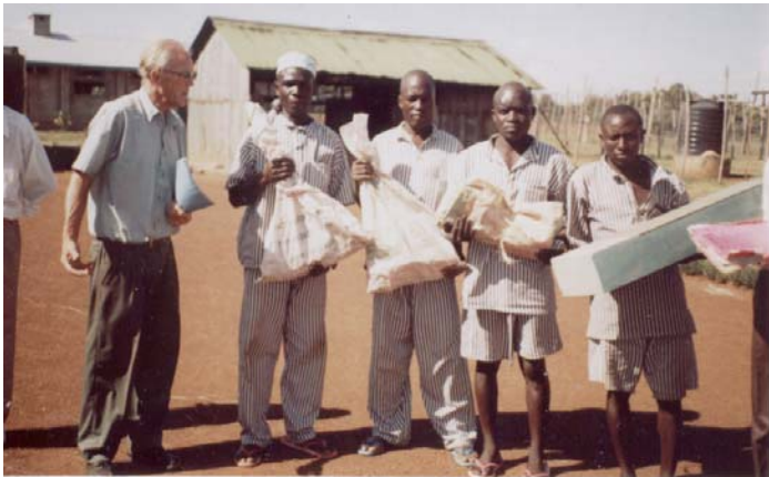
Uitreiking van gereedschapspakketten na diplomering en kort voor vrijlating

Hun doel is om de waardigheid van de gevangenen te vergroten en samen te werken om rehabilitatie en de re-integratie bij terugkeer in de samenleving te bevorderen. Door het aanbieden van basisvaardigheden (basisschool diploma's) en het aanleren van technische vaardigheden en vaktraining zijn de sleutel tot het opbouwen van een zelfstandig bestaan als men de gevangenis verlaat.