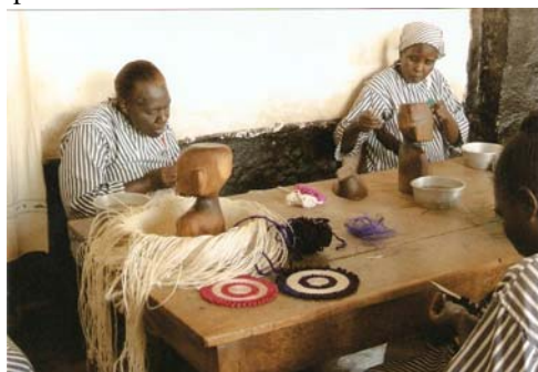
Handicraft vrouwen-gevangenis Langata Nairobi

In de gevangenis worden zij voorzien van kleding, dekens, boeken, maandverband, speelgoed en medicijnen. Dit verdient speciale aandacht van het team.