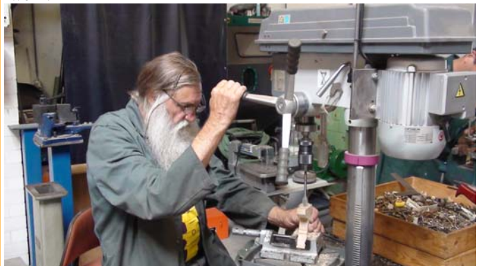
Revisiewerk in de DWJ werkplaats

De revisiewerkzaamheden zijn gebaseerd op de levering van gereviseerde producten van hoge kwaliteit en het verstrekken van trainingen aan inwoners van donorlanden en zijn daarmee een uitstekend "gereedschap" om mensen toe te leiden naar werk.