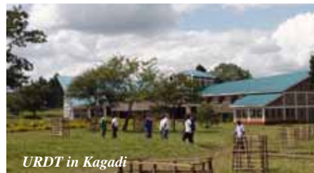
URDT in Kagadi

Ook Ugapriivi , een samenwerkingsverband van technische scholen, levert SKIT deelnemers uit de omgeving van Kagadi.