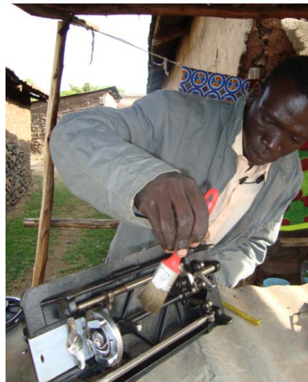
Monteur in de sloppenwijk Kisumu aan het werk