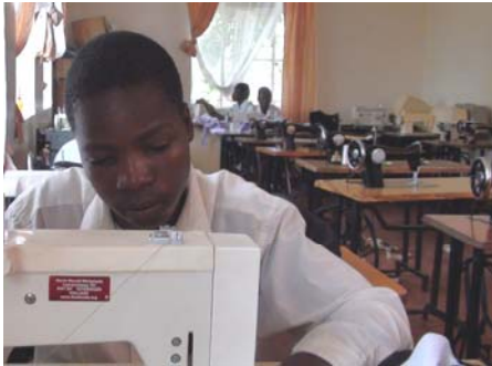
Een leerling bezig op een DWW naaimachine

teurs bezoeken ook andere scholen in Kisumu om onderhoud aan de naaimachines te doen. Vlak voor de landelijke praktijkexamens wil elke school de machines in orde hebben voordat de praktijkexamens in kledingmaken beginnen.