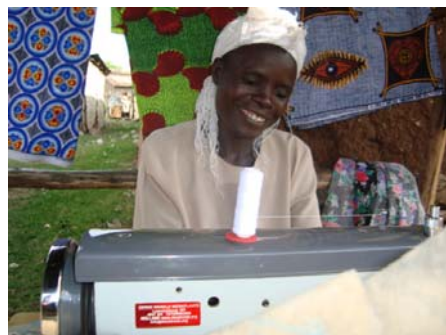
Kleine zelfstandigen met een DWW naaimachine