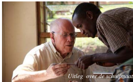
Uitleg over de schuifmaat

Hoofddoel blijft intussen de introductie van het vak ‘maintenance en repair’ van naai,- en breimachines op hun scholen. Zo moet de verworven kennis verder verspreid worden. Voor ondersteuning van dit alles komen er ook enkele Servi-