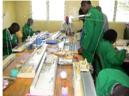
SKIT cursus 2006 Nairobi, breimachinerevisie