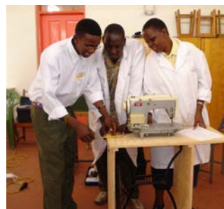
Trapnaaimachines leren maken