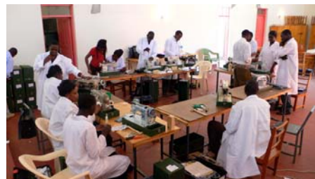
SKIT cursus in Kisumu 2008