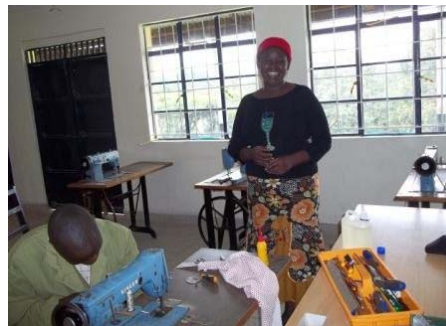
Revisiewerk van Elgon Slopes Solution Center

mei 2011 tien naai-, en breimachine- monteurs opgeleid heeft. Hij krijgt daarbij hulp van drie ex-gevangenen die hun opleiding in de gevangenis hebben gekregen. Hij pakt het professioneel aan want de deelnemers hebben een praktijk - en theorie-examen af moeten leggen. Alle tien deelnemers zijn geslaagd!