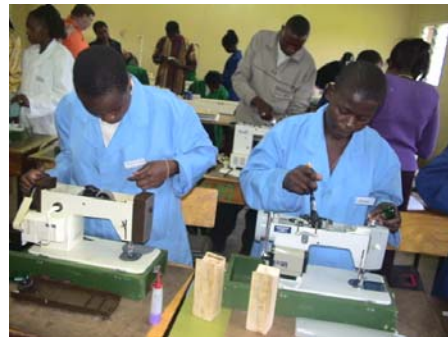
SKIT cursus 2007 Nairobi, naaimachinerevisie