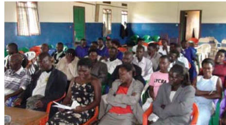
Bijeenkomst bij URDT met opgeleide monteurs

Nu na drie jaar zijn er 14 cursus deelnemers (3 mannen en 11 vrouwen) gecertificeerd en een andere cursist kreeg deelcertificaten. In die 3 jaar hebben de opgeleide cursisten 973 leerlingen les gegeven in naaimachineonderhoud en zij hebben 851 naaimachines gereviseerd. Via partner URDT zijn 45 van de 500 groepen van 10 handwerkslieden opgeleid. Deze 45 leiders hebben hun groep van 10 weer de kennis doorgegeven. Dus zijn er 450