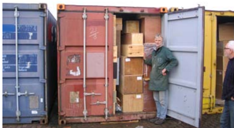
De 6e DWW container 2011 is eind december vol gepakt en gaat begin 2012 naar Kenia

beidsproces hebben gezeten, samenwerken met deelnemers aan een re-integratietraject. Er zijn ongeveer 45 vrijwilligers werkzaam in de revisie. De meeste vrijwilligers zijn al heel lang verbonden aan de werkplaats. In 2011 waren er drie vrijwilligers die meer dan 20 jaar bij de werkplaats werkzaam waren. Daarnaast hebben we acht stafleden die de dagelijkse gang van zaken op de afdelingen regelen en het magazijn met ingekomen goederen verzorgen.