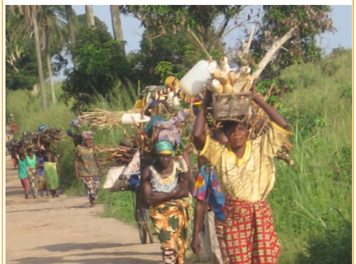
Vrouwen in DR Congo lopend onderweg met voedsel voor de markt of van de markt en met hout om eten te koken

maken en kan de planken laten ophalen door een fiets met een kar. Ook de kant en klare producten kunnen per fiets naar de markt of naar de klant gebracht worden. Dit betekent tijdswinst voor de timmerman en een baan voor de transporteur op de fiets. (millenniumdoel; 1 armoede bestrijden)