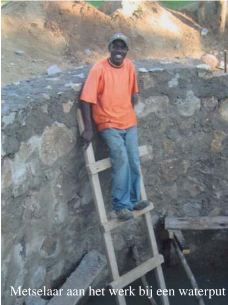
Metselaar aan het werk bij een waterput

DWW heeft 20 gereedschapkisten geleverd voor automonteurs, elektriciens, metaalbewerkers, timmermannen, bouwvakkers en loodgieters en ook een zaagtafel, kolomboormachine, lasapparatuur en bankschroeven. Er werken nu 10 mensen met een gedeelte van de ontvangen goederen. Na voltooiing van de werkplaats zal er een veilige opbergplek zijn voor al het gereedschap. Er wordt naar gestreefd