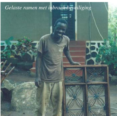
Gelaste ramen met inbraak-beveiliging

DWW heeft 20 gereedschapkisten geleverd voor automonteurs, elektriciens, metaalbewerkers, timmermannen, bouwvakkers en loodgieters en ook een zaagtafel, kolomboormachine, lasapparatuur en bankschroeven. Er werken nu 10 mensen met een gedeelte van de ontvangen goederen. Na voltooiing van de werkplaats zal er een veilige opbergplek zijn voor al het gereedschap. Er wordt naar gestreefd