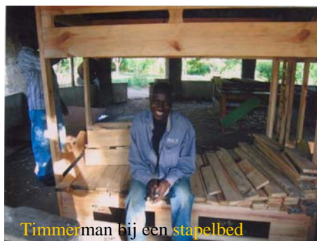
Timmerman bij een stapelbed

Upendo Daima begeleidt de opvang van straatkinderen. Er wordt geprobeerd de kinderen weer terug te brengen bij hun familie. Vervolgens worden ze geholpen met het zoeken naar werk. De organisatie heeft besloten om zelf een inkomengenererende werkplaats op te zetten. De werkplaats is gevonden en opgeknapt. De